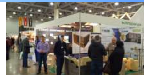
Государственный Университетский конференция по деревянному домостроению и деревообработке